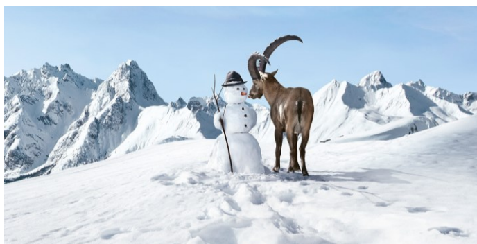
„Du Gian, er do het die kurrilige Aargauer au ned gseh...!“

Unterwegs haben wir einen leicht rotköpfigen Stesi aufgelesen. Ihm hat man das Brett in der Hütte gestohlen, weswegen er ein Spezialfahrdienst in Anspruch nahm. Zudem hatte er noch seine Autoschlüssel verloren, welche aber von Marc dann unter dem Tisch gefunden wurden. (wer weiss was er dort machte...)