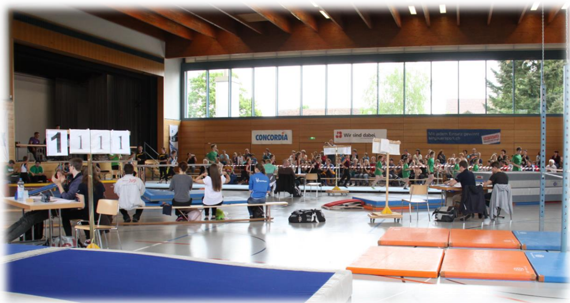
Die Niederwiler Turnhalle verwandelte sich am 9. Und 10. Mai in eine tolle Wettkampfanlage.