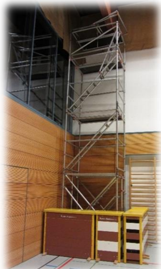
Akrobatische und gefährliche Montage der Verdunkelungen

Nachdem unsere Vorstösse nichts gebracht haben, haben wir gemeinsam mit dem Musikverein, der Jungwacht und den Theaterfreunden im Oktober 2014 ein Gesuch eingereicht.