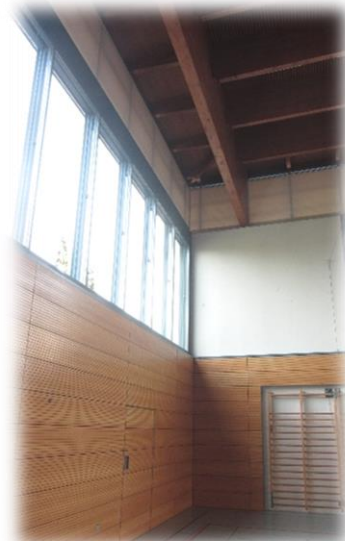
Die neuen, fix montierten Verdunkelungen

Wir beantragten eine zweckmässige, wirkungsvolle Verdunkelung die nicht vor jedem Anlass in luftiger Höhe akrobatisch montiert und danach wieder demontiert werden musste. Die Sachlage und das hohe Risiko wurden erkannt und nach einer geeigneten Lösung gesucht. Der Kredit wurde bewilligt und bereits in den vergangenen Frühlingsferien wurden die Verdunkelungen fix montiert. Und zwar in beiden Hallen. Dies, damit bei ganztägigen Veranstaltungen wie z.B. Sportwettkämpfen einfallendes Sonnenlicht nicht zu gefährlichen Blendungen führen kann.